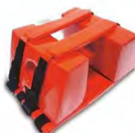
Fermacapo universale per tavola spinale