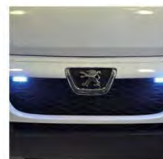
Strobo led blu su mascherina anteriore