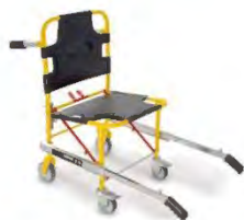
Sedia portantina a 4 ruote completa di 2 cinture