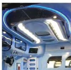
Illuminazione interna perimetrale notturna a 300 Led blu