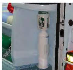
Supporto in metallo per bombola O 2 portatile