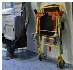
Bloccaggio per sedia portantina