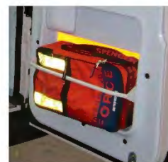
Supporto per valigia da scasso