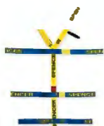
Sistema cinture per tavola spinale